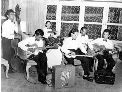
Timor Rhythm Brothers begin 50er jaren.

Tielman Brothers hun eerste Music Movie Award.