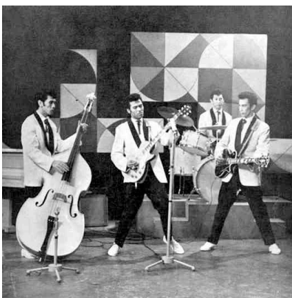
Tielman Brothers in de TV-Show in 't Spant.

In januari 1960 maakte Den Haag voor het eerst kennis met The Tielman Brothers in de grote zaal van de Haagse Dierentuin. Daaropvolgend was er een groot Televisie-optreden en verschenen ze ook in de bekende Weekend Show (vanuit 't Spant in Hilversum). Dit veroorzaakte een ware sensatie en de aanbiedingen voor optredens waren niet meer van de lucht. De TV en muziekcensenten hadden echter geen goed woord over door de vier broers en een stortvloed van negatieve kritieken verschenen in de kranten. Dit verstomde echter gelukkig weer vrij snel, omdat het publiek zich hiervan niets aantrok en de broers volle zalen bleven trekken. Grote platencontracten, o.a. met Bovema waren het gevolg.