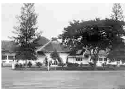
HBS in Surabaya

ons avondeten en mochten we veldflessen met water vullen. Na het eten zette de trein zich weer in beweging en gingen we de nacht tegemoet. Van slapen kwam niet veel; daarvoor waren we veel te gespannen. Na twee dagen kwamen we in Surabaya aan. Een aantal vrachtwagens stond op ons te wachten. Met veel geduw en gekrijs werden we in de wagens gejaagd. De rit duurde niet lang. Langs de weg zagen we weinig Europeanen maar des te meer Indonesiërs. Enkelen scholden ons uit voor "blanda boesoek" en ze balden hun vuisten.