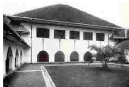
HBS in Surabaya

constant bezig om deze met zeewater schoon te spuiten.