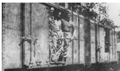
Met 30 man in een goederenwagon

Geregeld zagen we groepen van ongeveer 200 man vetrekken. En na een maand waren mijn broer Adriaan en ik ook in zo'n groep ingedeeld. Erg jammer dat de twee Pereira's er niet bij waren. Want in de maand dat we een kongsie vormden, waren we echt goed bevriend geraakt en lief en leed gedeeld. Met vrachtauto's reden we door Singapore naar het station. Ook nu weer werden we bekogeld met allerlei soorten fruit, wat in grote dank werd aangenomen.