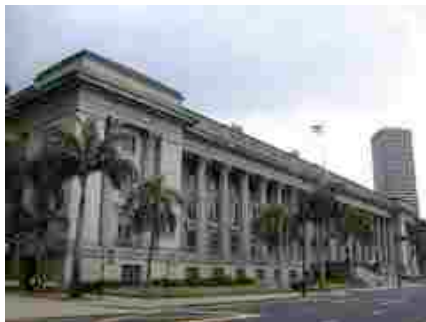
Changi gevangenis in Singapore

Waar hij het vandaan haalde mag Joost weten, maar op een dag zag ik mijn broer met een hamer en beitel een boomstronk te lijf gaan. Zo kwamen we aan hout om te koken. Bij de Japanse keuken mochten we soms een grote viskop uit de afvalton halen. Ik zorgde voor groenten, bestaande uit jonge bladeren van de bloestroe, een soort klimplant. De viskop met de bloestroebladeren werden gekookt in een Engelse helm. Dit was een goede aanvulling van wat we uit de keuken kregen.