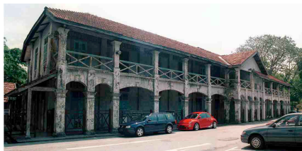
Britse kazerne in Singapore verkeert nu in erbarmelijke staat. Foto: Timothy M. Ciccone. (niet zeker of dit juiste kazerne is)

De eerste dagen keken we echt onze ogen uit. Alles was schoon, de gazons onderhouden en er lagen zware kanonnen die nog van de Engelsen waren. Het hele complex was echt brandschoon. Je kon er nog geen takje of stukje hout vinden, want alles wat maar branden kon, werd gebruikt om te koken. We hadden al gauw een kongsie (een elkaar steunend groepje) van 4 man, twee Pereira's en twee Van Lings. De oudste Pereira was een vriend van mijn broer en werkte bij de kampstaf. Hij bracht soms wat schrijfpapier mee, wat ik moest verkopen als sigarettenpapier. Je kon er namelijk gemakkelijker aan tabak komen dan aan sigarettenpapier. Van de opbrengst kochten we dan eieren bij de kampkantine.