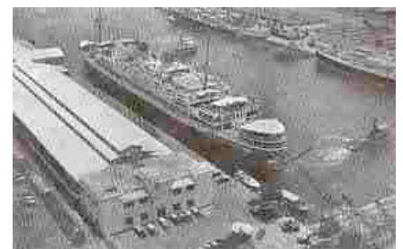
Haven van Tandjung Priok, Batavia

stonden ongeveer vijf meter uit elkaar en we moesten ervoor zorgen dat de kabel de grond niet raakte. Op het laatst voelden we onze armen niet meer en vooral de felle zon zorgde ervoor dat sommigen flauwvielen. Met enkele stokslagen en veel "koerah" geschreeuw waren ze snel weer op de been.