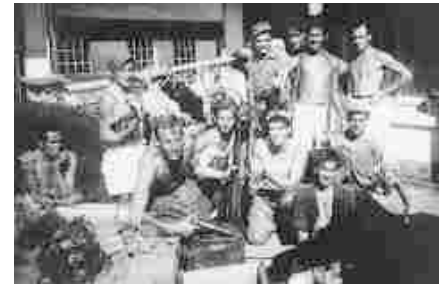
"Voetbalteam" in een Jappenkamp

een voetbalwedstrijd tussen Nederlanders en Engelsen. Ondanks de slechte toestand van het voetbalveld en het ongeschikte schoeisel was het toch een spannende wedstrijd geworden, waarbij wij met 2 - 1 wonnen, mede dankzij onze luide aanmoedigingen en ook die van de Aussies, want die waren allemaal voor de Dutchies.