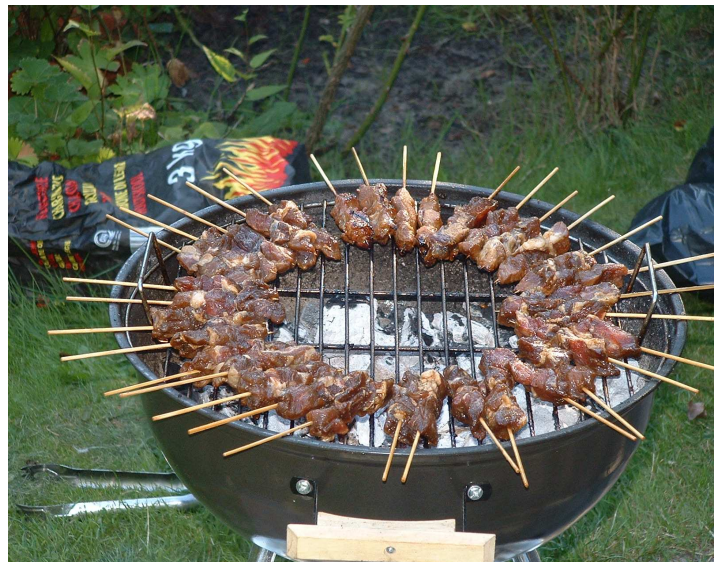
Sateh Pasar Jembatan 2006